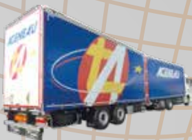
REMORQUE ET SEMI REMORQUE